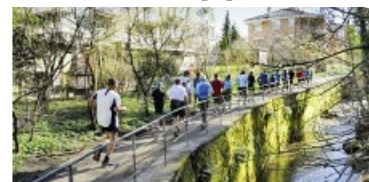
Renntreffs in Zürich.

«Züri rännt» ist eine frei zugängliche Läuferplattform. Einmal im Jahr findet ein Lauftreff durch die zwölf Zürcher Stadtkreise statt. Per März wurde das Angebot deutlich ausgebaut. Neu gibt es wöchentliche Lauftreffs; jeden Dienstag von 6.30 bis 7.30 Uhr mit Start/Ziel im Platzspitz. Und jeden Donnerstag von 19 bis 20 Uhr mit Start/Ziel im Pfingstweidpark.